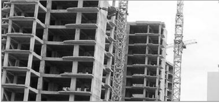
صورة سبيل على

أوضحت وزارة السكن والعمران، في تعليمة وجهتها إلى مديريات البناء والتعمير، أن المواطنين الراغبين في تسوية وضعية سكناتهم مطالبون بالتقدم إراديا إلى المجالس الشعبية البلدية، لإيداع ملفات الحصول على رخص البناء، وشهادات المطابقة التي تستلزم كوثيقة أساسية مستقبلا، في عقود التوثيق المتعلقة بالإيجار أو البيع، أو للحصول على عقود الملكية، وقد شرعت وزارة السكن والعمران بالتنسيق مع مصالح وزارة الداخلية أول أمس، في تنظيم لقاءات جهوية للتحسيس بعملية تسوية وضعية البيانات، وأكدت وزارة السكن في توضيحاتها حول كيفية تطبيق القانون المتعلق بمطابقة البيانات، وإتمام إنجازها الصادر في 2008، أن البيانات الواقعة بالقرب من الموانئ والمطارات والمنشآت الإستراتيجية، غير قابلة تماما لإجراءات المطابقة، إضافة إلى البيانات المتواجدة بالقرب من المناطق المعرضة للفيضانات والتوسع السياحي والمعالم التاريخية والأثرية والسواحل، وكذا الأراضي الفلاحية والغابية. وألزمت وزارة السكن العمران بالتنسيق مع وزارة الداخلية والجماعات المحلية، بضرورة توفير الإستمارات الخاصة بالتصريح بمطابقة البيانات من طرف البلديات