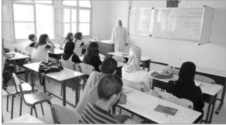
تلاميذ جعفر سعادة

وعليه فقد اقترح الإتحاد الوطني لعمال التربية "لوفاب"، ضرورة استحداث عطلة أبوية سنوية بنصف الأجر، لرعاية صحة الأبن المريض، وكذا استحداث منحة مكافأة جزافية خاصة بالعميل، لتمكين العمال والموظفين من الاستمتاع بعطلة رفقاة عائلاتهم، إلى جانب الرفع في منحة المرأة الماكثة بالبيت إلى 5 آلاف دينار، مع تخصيص منحة للمرأة العاملة المرضعة، والرفع المعتبر من القيمة المالية للمنحة الموجهة للأولاد من دون أي تمييز. إضافة إلى تخصيص منح قروض من الخزينة العمومية، معفاة من الضرائب وبدون فوائد، ليستفيد المربي من وسيلة نقل. وأما بخصوص الأجور؛ فقد أعدت النقابة جدول يبين كيفية حساب مبلغ النظام التعويضي بالنسبة للراتب الشهري، وعليه فقد تم التوصل إلى أن الراتب الموجه لمعلمي المدارس الابتدائية المصنفون في السلمين 7 و 10، سيقفز من 20 ألف دينار إلى 38 و 50 ألف دينار، في حين سيقفز الأجر الخام لأساتذة التعليم الأساسي في السلم 11، من 29 ألف دينار إلى 55 ألف دينار، كما أن أجور أساتذة التعليم الثانوي المصنفون في السلم 13 من 33 ألف دينار إلى 64 ألف دينار، مقابل ارتفاع في رواتب الأساتذة الرئيسيين للتعليم الثانوي، المصنفون في السلم 14 من 36 ألف دينار على 68 ألف دينار. وأما بالنسبة لموظفي التربية، فإن رواتب مساعدو التربية سيقفز من 20 ألف دينار إلى 38 ألف دينار، في حين ستقرر رواتب