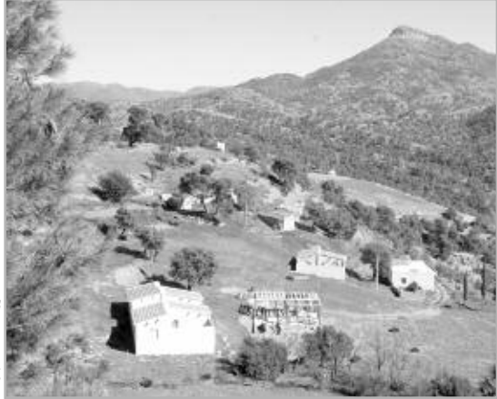
مجموعة من المساكن

يأتي قرار الحكومة هذا، تطبيقا لتعليمات الرئيس بوتقلية، التي أعلن عنها في أحد المجالس الوزارية، والرأمية إلى إنشاء تجمّعات سكنية ريفية تتوفر على كافة شروط الحياة، من غاز وكهرباء وطرق وغيرها، بغية القضاء على أزمة السكن هناك، والتقليل من حجم الزحف الريفي نحو المدن. وستعطي الأولوية في الحصول على هذه السكنات، التي ستكون على شاكلة قرى، لفئة الشباب، من خلال منحهم قروض متفاوتة بالاستناد إلى قدرة التسديد بنسب فوائد مخفضة محددة بما من المائة، وحسبما أفاد به، بوعلام جبار، الرئيس المدير العام لبنك الفلاحة والتنمية الريفية "بدر" بنك، في تصريح خص به "النهار"، فإن مصالحه قد انتهت من إعداد الصيغة النهائية لتمويل التجمّعات السكنية الريفية، التي نادى بها الرئيس بوتقلية، حيث سيتم حسبها -منح قروض بقيمة 3 ملايين دينار أي ما يعادل 300 مليون سنتيم فما فوق، لكل من يرغب في الحصول على مسكن